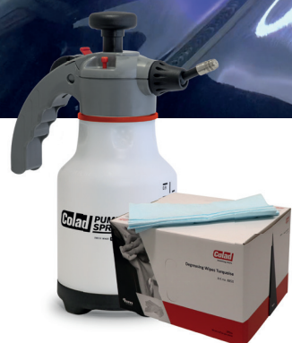
Pumpflaska Ultimate Art nr 9704