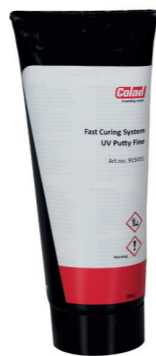
Snabbhärdande UV-kitt Fint Art nr 915011

190 g. Tub För fyllning av små sprickor, bucklor och stenscott