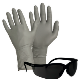
Korttidshandskar i nitril grå Art nr 53820x