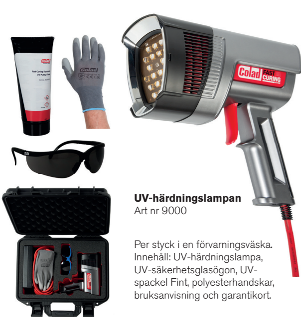
UV-härdningslampa Art nr 9000

Per styck i en förvaringsväska. Innehåll: UV-härdningslampa, UV-säkerhetsglasögon, UV-spackel Fint, polyesterhandskar, bruksanvisning och garantikort.