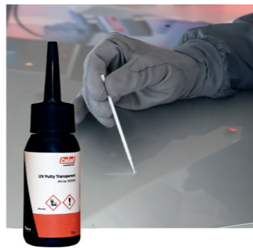
Snabbhärdande UV-kitt Transparent Art nr 915033

220 g. Tub För fyllning av även de allra minsta mikrohålen