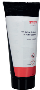
Snabbhärdande UV-kitt Grovt Art nr 915020

Per styck i en förvaringsväska. Innehåll: UV-härdningslampa, UV-säkerhetsglasögon, UV-spackel Fint, polyesterhandskar, bruksanvisning och garantikort.