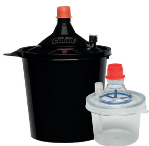
Snap Lid System® UV Art nr 9370xxxSLSUV