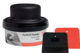
Kontrollpulver Art nr 8035