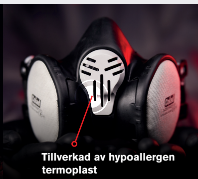
Tillverkad av hypoallergen termoplast