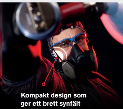
Kompakt design som ger ett brett synfält