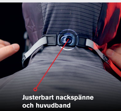
Justerbart nackspänne och huvudband

För skydd mot skadliga ångor och partiklar!