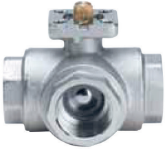
ART. S.1070 BALL•O•MATIC T-PORT